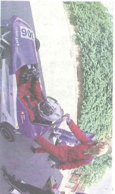
Les courses de ce type ne sont désormais plus l'apanage des garçons : le domaine connaît une féminisation galopante.

► Les villages sans pente ne sont pas exclus d'office des compétitions de courses à savon si elles acceptent de pratiquer du push-car. Comme son nom l'indique, il s'agit d'imprimer de la vitesse en poussant le pilote et son engin. Ou comment vivre une panne d'essence pour le plaisir.